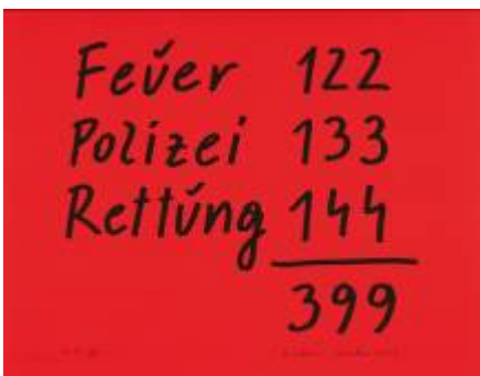
4. Dietmar Brehm Alarm, 2003