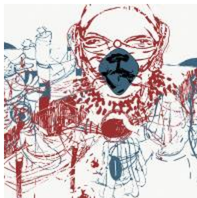
10. Oliver Dorfer Nordic Print 01, 2009