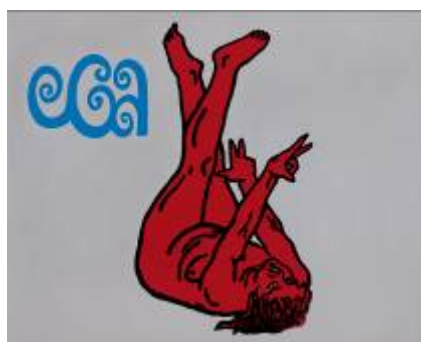
5. Dietmar Brehm Verrenkung 2, 2005