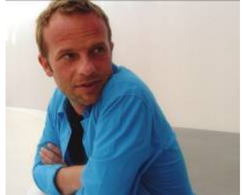
3. Porträt Oliver Dorfer Foto: Oliver Dorfer