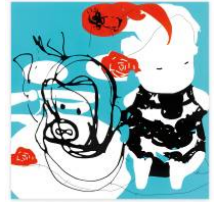
11. Oliver Dorfer Pond02, 2008