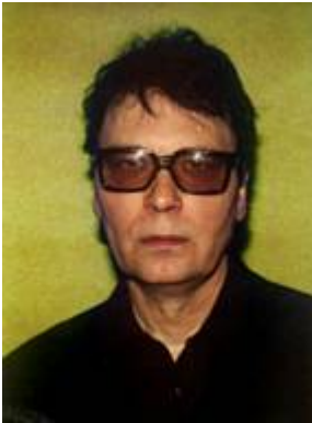
1. Porträt Dietmar Brehm