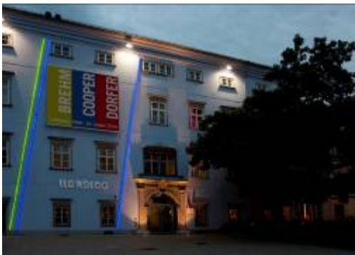
7. Waltraut Cooper Fassade Nordico "Three Lines", 2009 © VBK, Wien, 2009