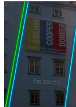
8. Waltraut Cooper Fassade Nordico "Three Lines", 2009 Foto: Paul Kranzler © VBK, Wien, 2009